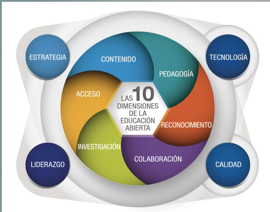
Ilustración de “Las 10 Dimensiones de la Educación Abierta” por ©Union Europea, bajo una licencia Creative Commons Atribución 4.0 Internacional (CC BY 4.0). (Trad. Fundación Universia).